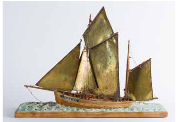
326 Maquette diorama représentant un bateau de pêche «Concarneau», voiles en laiton, l. 68 cm y compris le socle. 300/400 €