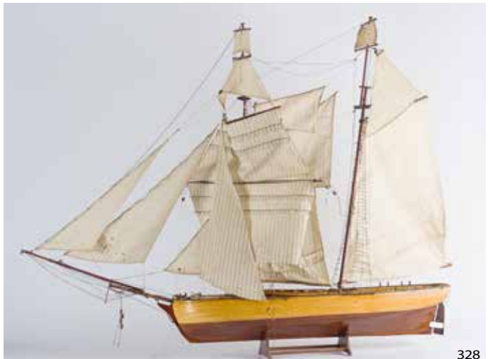
328 Maquette de Goélette trois mâts L : 100 cm y compris le mât de phoque, H : 80 cm 500/600 €