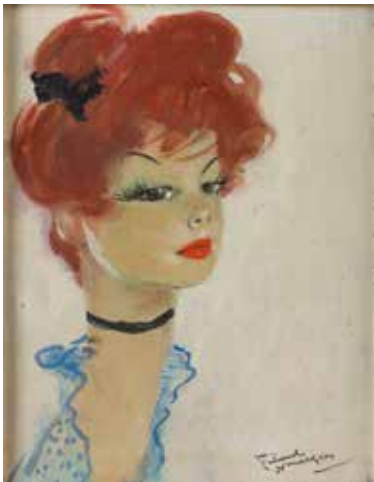
146 Jean Gabriel DOMERGUE 1889-1962 «Nadega, portrait en buste d'une élégante» peinture sur panneau, SBD, 23.5x19cm 2 000/2 500 €