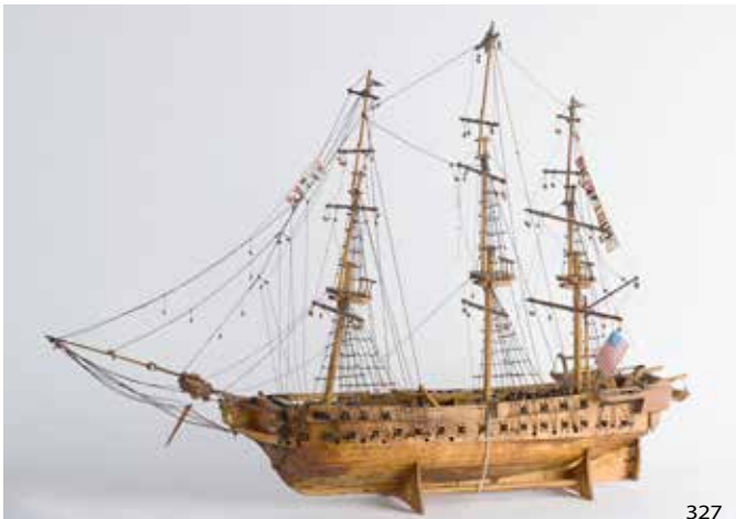
327 Maquette de bateau de guerre trois mâts américain canon en bronze, restauration sur la coque, fin XIXème, L : 65cm 500/600 €