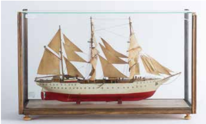
325 Maquette de Goélette trois mâts sous verre, L : 50cm 600/700 €