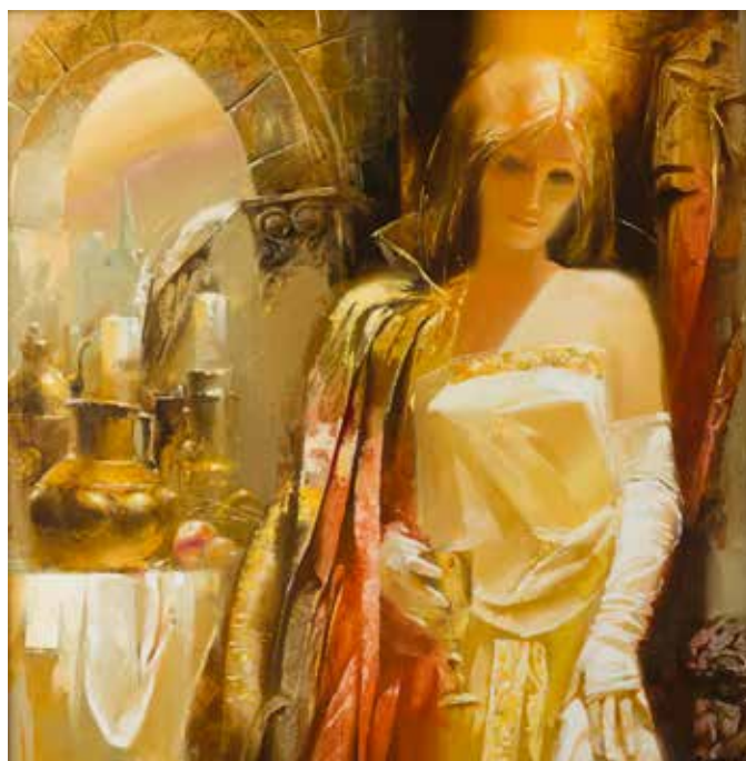
175 Ramon GARASSUTA «Enigme d'or» HST, SBD, 80x80cm 3 000/4 000 €