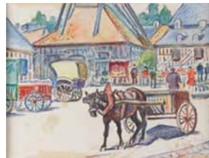
167 Henri DE SAINT DELIS «Place Saine Catherine» aquarelle, SBD, 24x31cm 1 500/2 000 €