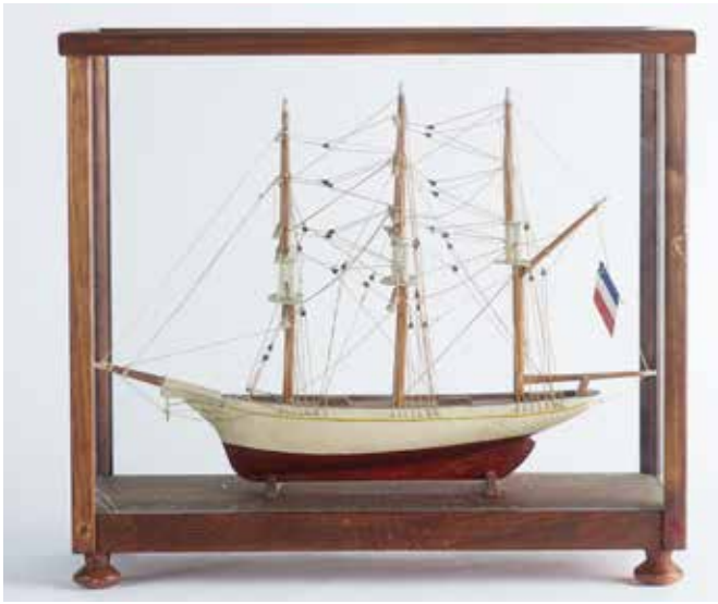
323 Maquette de Morutier trois mâts sous verre, L : 40cm 400/500 €