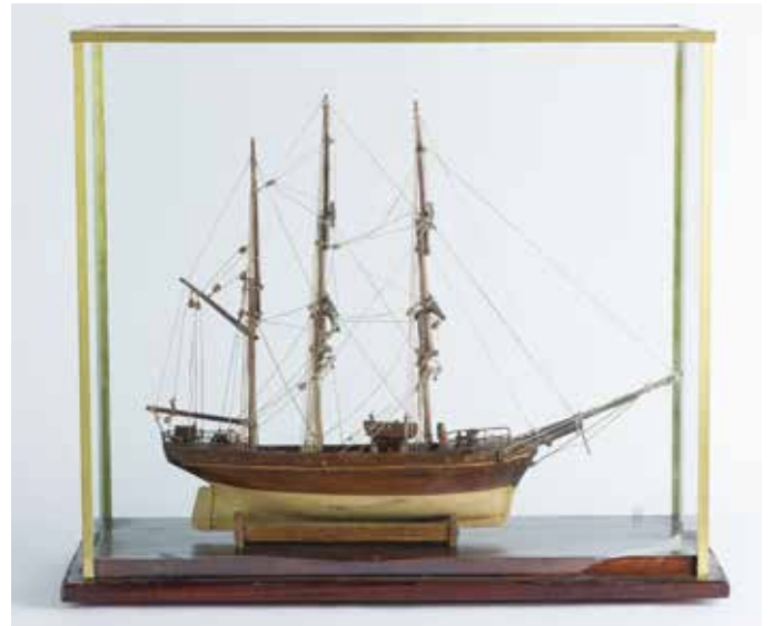
324 Maquette de Morutier trois mâts sous verre, L : 47cm y compris mât de Foc 500/600 €